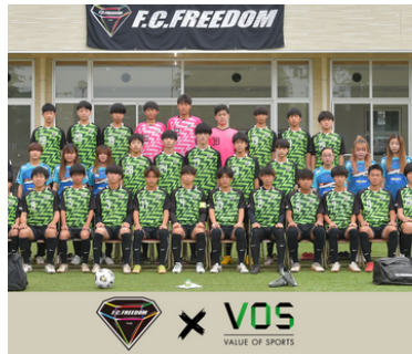
F.C.FREEDOM VOS VALUE OF SPORTS