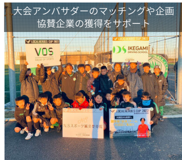
大会アンパサダーのマッチングや企画 協賛企業の獲得をサポート