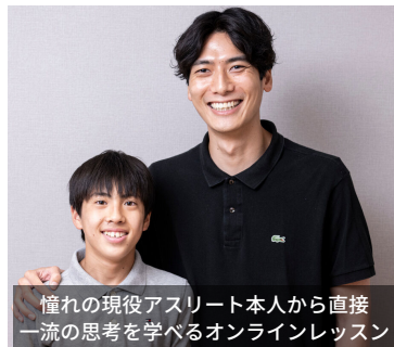
憧れの現役アスリート本人から直接 一流の思考を学べるオンラインレッスン