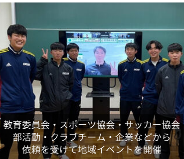
教育委員会・スポーツ協会・サッカー協会 部活動・クラブチーム・企業などから 依頼を受けて地域イベントを開催